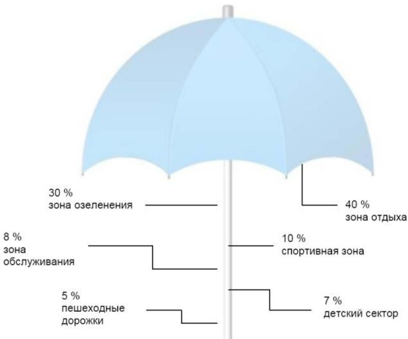
Рисунок 1 - Схема функционального зонирования территории пляжа

При зонировании необходимо учитывать потенциальное воздействие шума. Уровень шума на пляжах не должен превышать 45 дБА в дневное время суток, и кратковременно (в течение 1 мин) не более 80 дБА.